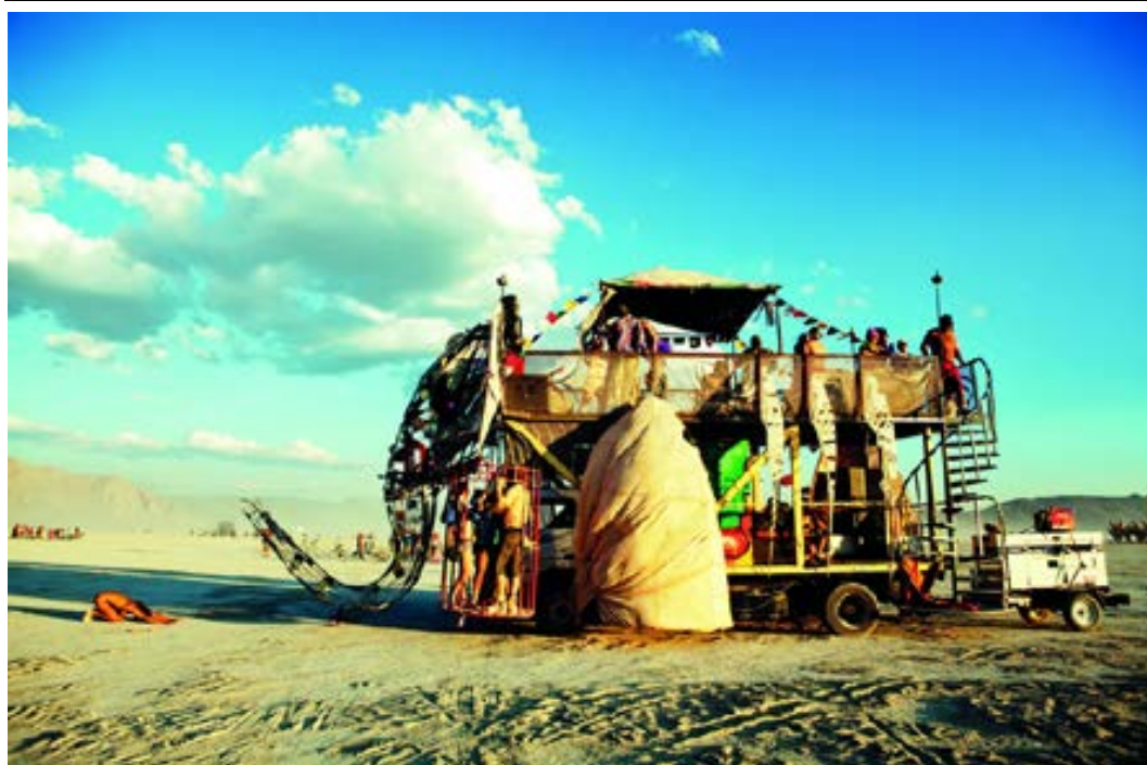
The Yoke